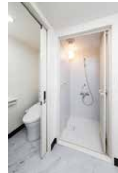
シャワーユニット・トイレ